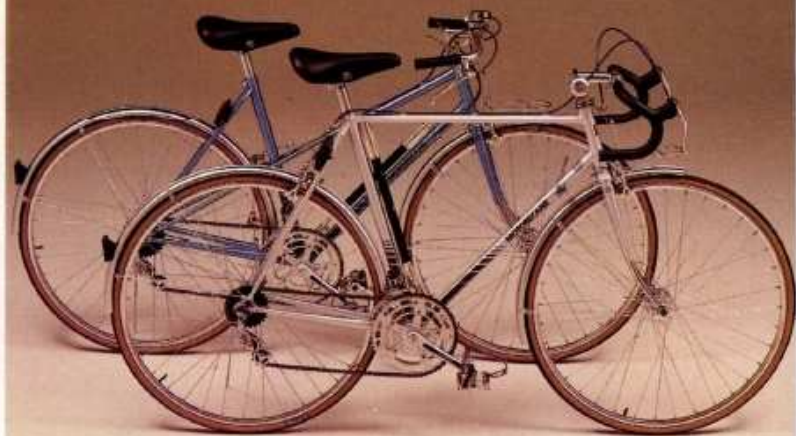
TR 2 TR 2M