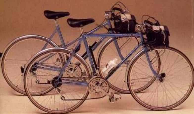
CT 3 CTM 3

Chaque pièce d'un vélo doit être choisie avec soin. C'est aussi vrai pour les coureurs qui briguent le bouquet du vainqueur que pour les amateurs dont l'ambition se limite à la promenade et au plaisir de pédaler sainement. Pour concevoir et construire un beau vélo, les spécialistes de Motobécane ne laissent rien au hasard : leur expérience est irremplaçable.