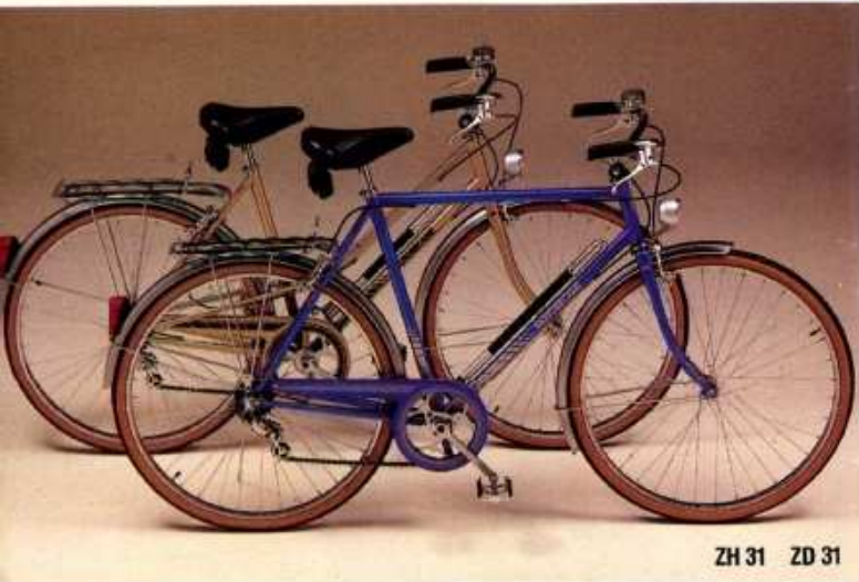
ZH 31 ZD 31