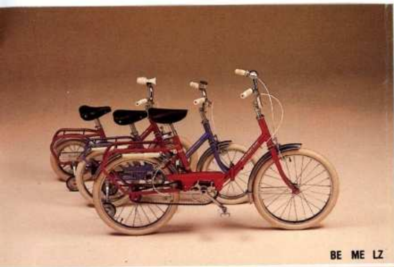
BE ME LZ