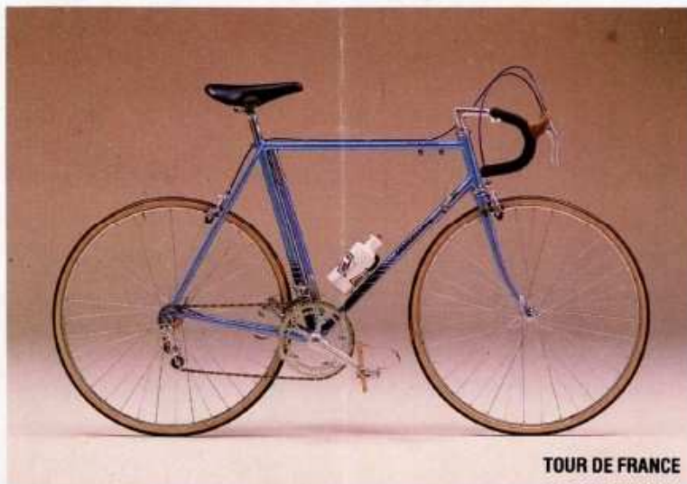
TOUR DE FRANCE

Votre Agent vous renseignera sur ces possibilités.